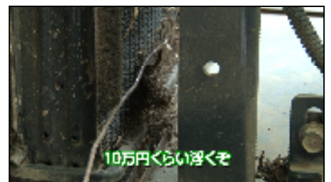
ラジエータの詰まり掃除で10万円浮く