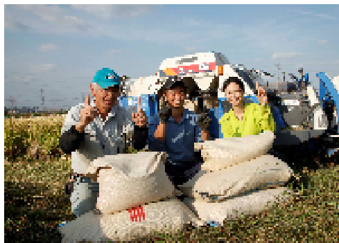
ワラ切り刃と深こぎ改善で1袋増収