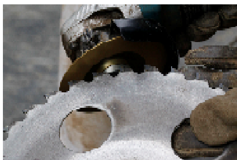
簡単目立てで切れ味バツグンに