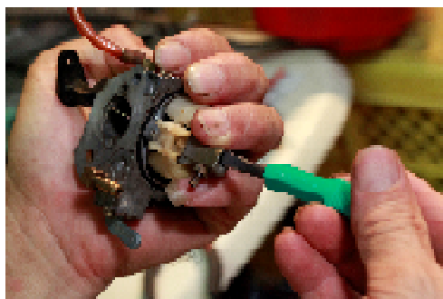
キャブレター掃除でエンジン復活