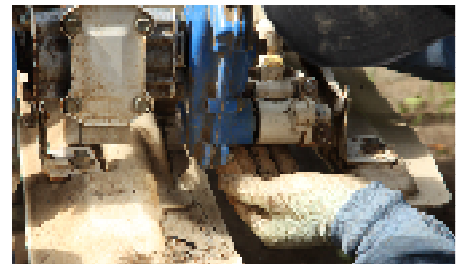
植え付け部の絡まり掃除で5万円浮く